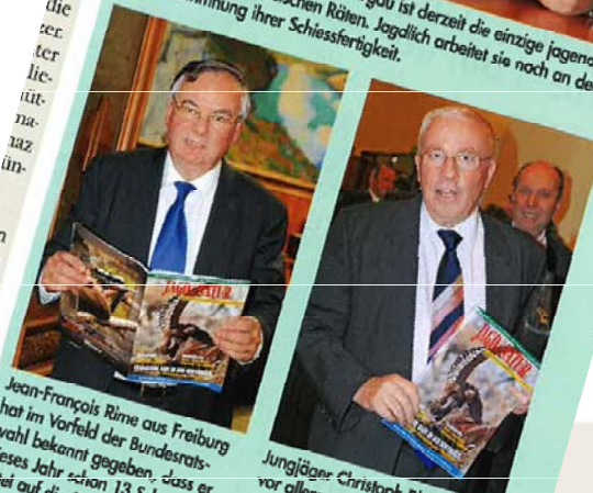
Jean-François Rime aus Freiburg hat im Vorfeld der Bundesratswahl bekannt gegeben, dass er dieses Jahr schon 13 Schwarzbäni auf die Schwarte gelegt hat - im Elsass natürlich und nicht etwa im Bundeshaus ...